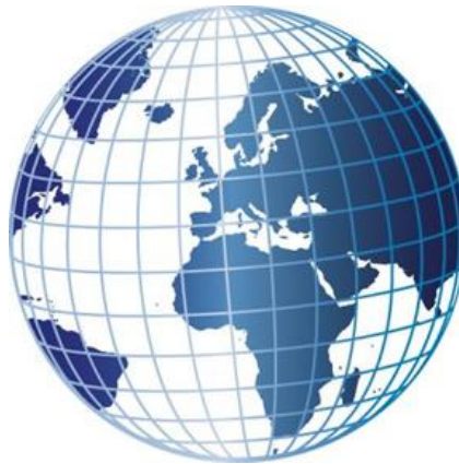
Paralelos e Meridianos: linhas imaginárias

Juntas, as latitudes e longitudes formam as coordenadas geográficas. A partir das coordenadas geográficas é possível localizar qualquer ponto existente na Terra, o que é muito útil para viajantes, marinheiros, e para quem gosta de saber exatamente onde está.